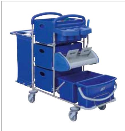
Abbildung zeigt Modell mit Sonderausstattung