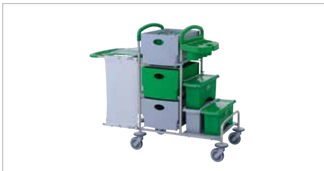
Clean Green STEC9K mit EasyMop Systemboxen Art.-Nr.: 3079915