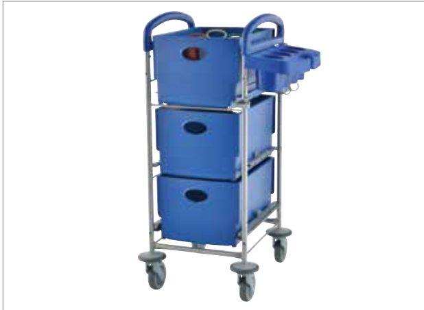
Maximaler Stauraum auf minimaler Grundfläche. Die neue Clino STEC20 Serie für Büros, Shops und Objekte mit wenig Abstellfläche