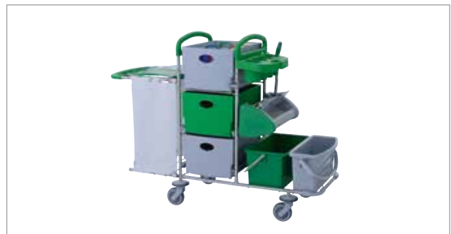
Clean Green STEC8 mit Flachpresse Ringo ST Art.-Nr.: 3078622