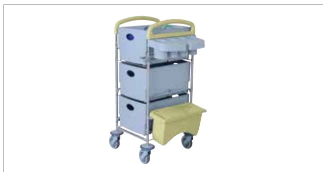
Clean Yellow STEC20 mit EasyMop Systembox Art.-Nr.: 3203030