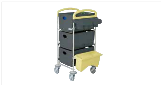
Midnight Yellow STEC20 mit EasyMop Systembox Art.-Nr.: 3203040

Ihrer Inspiration sind keine Grenzen gesetzt: Sämtliche Farben und Komponenten sind frei kombinierbar.