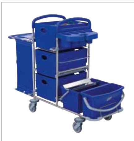
Abbildung zeigt Modell mit Sonderausstattung