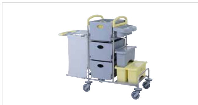
Clean Yellow STEC9K mit EasyMop Systemboxen Art.-Nr.: 3079917