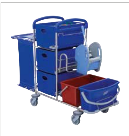
Abbildung zeigt Modell mit Sonderausstattung