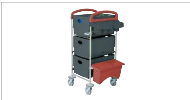
Midnight Red STEC20 mit EasyMop Systembox Art.-Nr.: 3203050