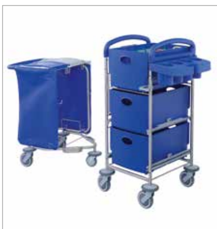
Abbildung zeigt Modell mit Sonderausstattung