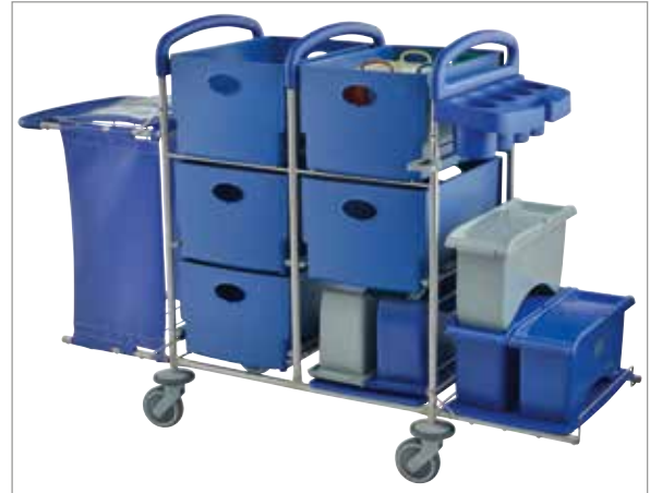
Die neue Clino STEC30 Serie – maximale Transportkapazität und hygienische Sicherheit für das Gesundheitswesen