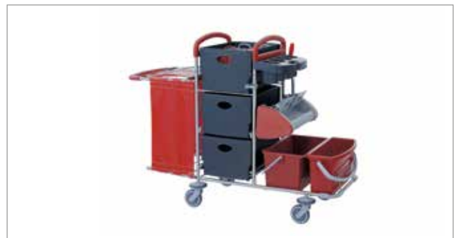
Midnight Red STEC7 mit Flachpresse Ringo ST Art.-Nr.: 3077622