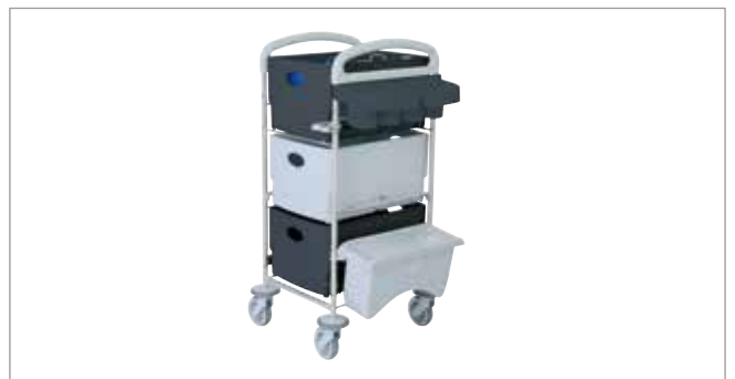
Midnight Grey STEC20 mit EasyMop Systembox Art.-Nr.: 3203020

Ihrer Inspiration sind keine Grenzen gesetzt: Sämtliche Farben und Komponenten sind frei kombinierbar.