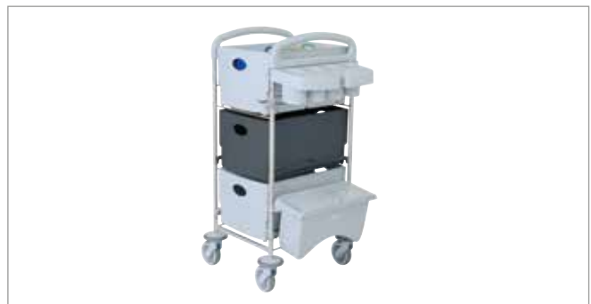
Clean Grey STEC20 mit EasyMop Systembox Art.-Nr.: 3203010