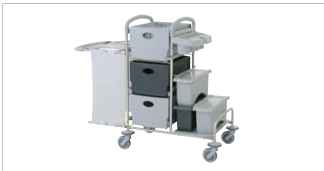
Clean Grey STEC9K mit EasyMop Systemboxen Art.-Nr.: 3079912