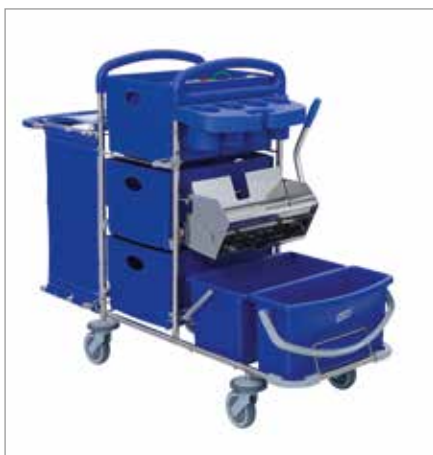
Abbildung zeigt Modell mit Sonderausstattung