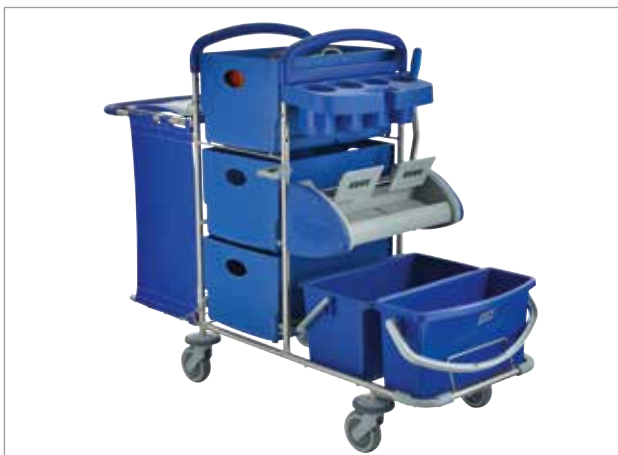
Clino STEC7 – umgerüstet auf Multi- und PlusBox