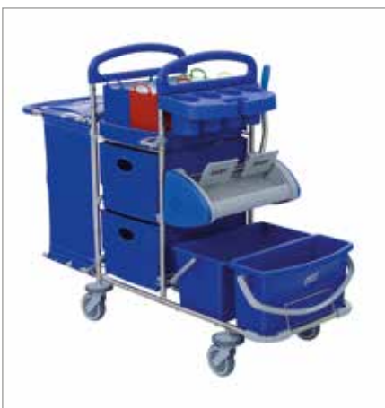
Abbildung zeigt Modell mit Sonderausstattung