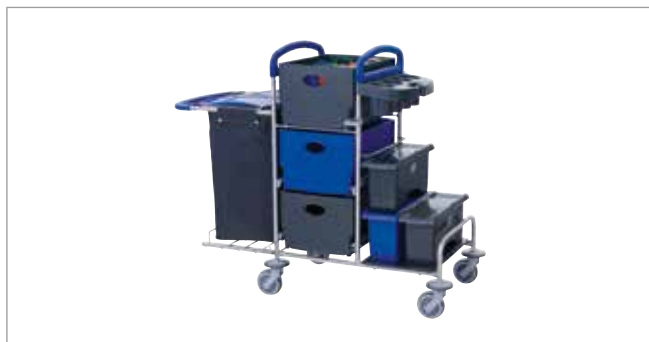
Midnight Blue STEC9K EasyMop mit Systemboxen Art.-Nr.: 3079911