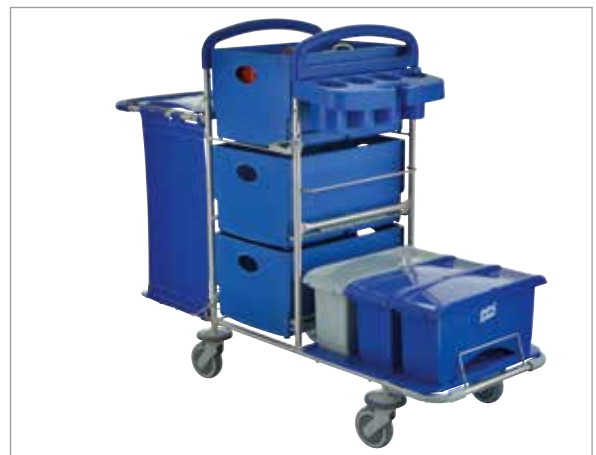
Clino STEC9L mit Multi- und PlusBox