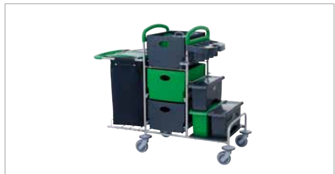
Midnight Green STEC9 mit EasyMop Systemboxen Art.-Nr.: 3079916

Ihrer Inspiration sind keine Grenzen gesetzt: Sämtliche Farben und Komponenten sind frei kombinierbar.