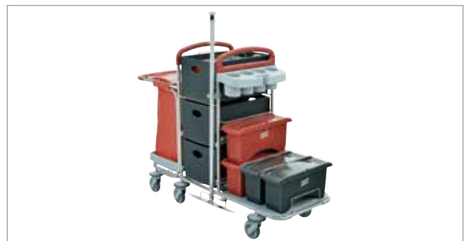
Midnight Red STEC9L mit EasyMop Systemboxen Art.-Nr.: 3079919

Ihrer Inspiration sind keine Grenzen gesetzt: Sämtliche Farben und Komponenten sind frei kombinierbar.