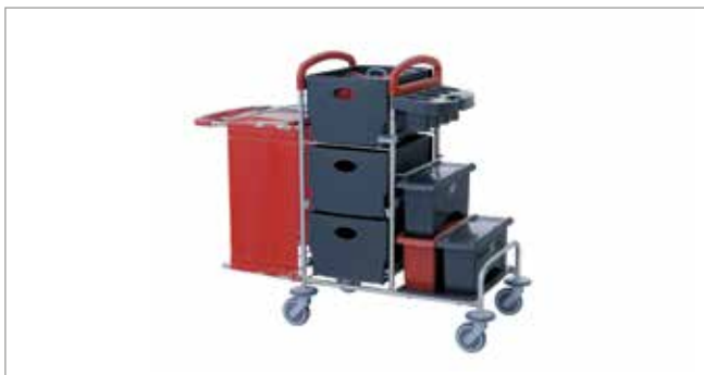
Midnight Red STEC9K mit EasyMop Systemboxen Art.-Nr.: 3079914