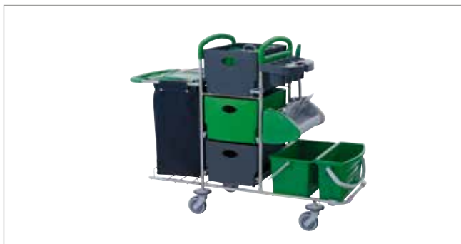
Midnight Green STEC7 mit Flachpresse Ringo ST Art.-Nr.: 3077623