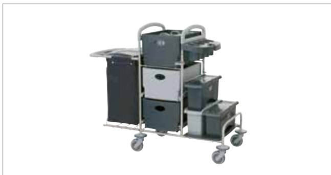
Midnight Grey STEC9K mit EasyMop Systemboxen Art.-Nr.: 3079913