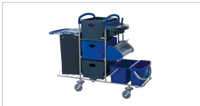
Midnight Blue STEC7 mit Flachpresse Ringo ST Art.-Nr.: 3077621

Ihrer Inspiration sind keine Grenzen gesetzt: Sämtliche Farben und Komponenten sind frei kombinierbar.