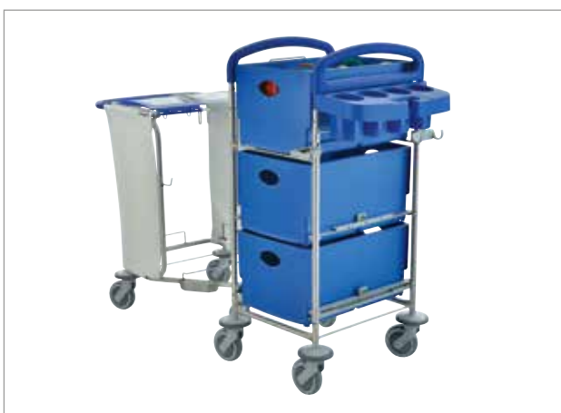
Clino STEC20 – mit abkoppelbarer Einheit