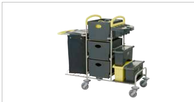
Midnight Yellow STEC9K mit EasyMop Systemboxen Art.-Nr.: 3079918