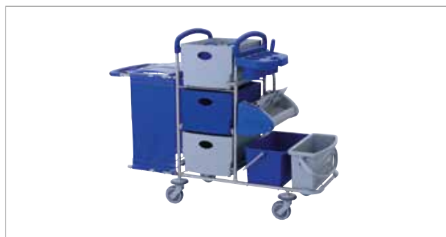
Clean Blue STEC8 mit Flachpresse Ringo ST Art.-Nr.: 3078621