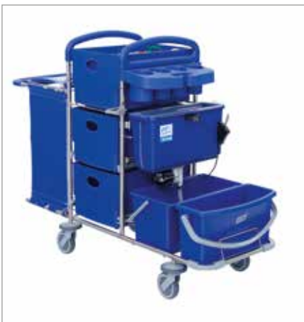
Abbildung zeigt Modell mit Sonderausstattung