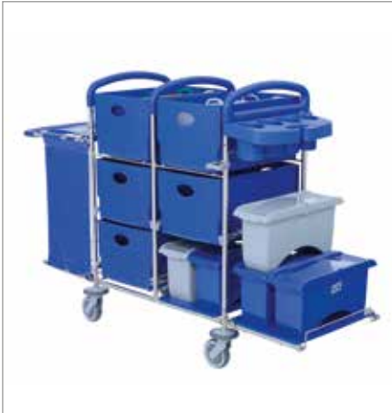
Abbildung zeigt Modell mit Sonderausstattung