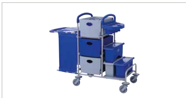
Clean Blue STEC9K mit EasyMop Systemboxen Art.-Nr.: 3079910